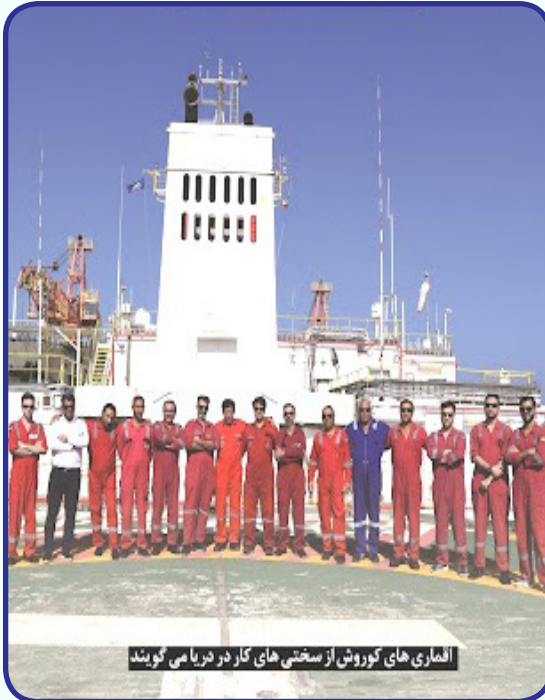
اعضای کوروش از سختی های کار در دریا می گویند

سکو با ساکنان جوانش، حال و هوایی متفاوت دارد. در یک بازدید مختصر و گپ و گفت های کوتاه با تیمی جوان با میانگین سنی ۲۸ تا ۳۰ سال مواجه می شوم که در میان آنها می توان تخصص های مختلف مهندسی نفت، مکانیک، برق، ابزار دقیق و... را دید. جامعه فعلی کارکنان شاغل